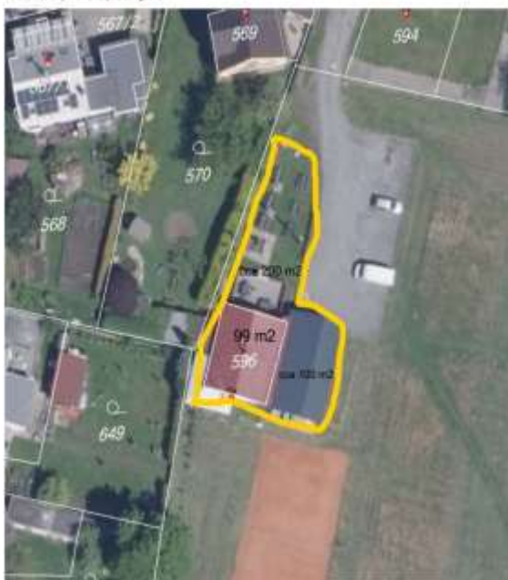
Zákres ploch - pronájem

Na základě ust. § 39 odst. 1 zákona o obcích č. 128/2000 Sb., o obcích, rozhodla Rada obce Baška dne 26.06.2024 zveřejnit záměr pronajmout budovu č. p. 234 Hodoňovice na parcele č. 596, přilehlou nezastřešenou terasu s navazující travnatou plochou na parcele č. 597 a přilehlou zastřešenou terasu na parcele č. 597, vše k. ú. Hodoňovice v obci Baška, ve vlastnictví Obce Baška, pro podnikatelské účely (hostinská činnost), a to na dobu neurčitou, nejdříve od 01.08.2024 paní Anně Kostelníkové, byt. Hodoňovice 155, 739 01 Baška. Situační plánek budovy a zákres předmětu nájmu ve fotosnímku jsou přiloženy.